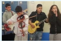
ההרכב המוזיקלי של שכבת ח' בפעולה