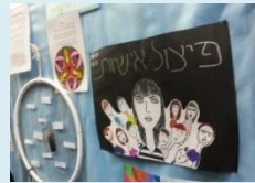
מימין לשמאל: פרט מהתערוכה - עבודה בנושא פיצול אישיות ועבודות נוספות, התלמידה עינב הרוש ליד הסרט שהפיקה בשאלת הגזענות בין יהודים לערבים והתלמידה דנית ראש והמחנכת אריאלה שרוני מציגות את העבודה: 'ספר ההמלצות שלי למתבגרים'.