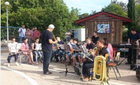
משמאל: קבלת פנים מוזיקלית - הביג בנד מקבלת את פני הבאים