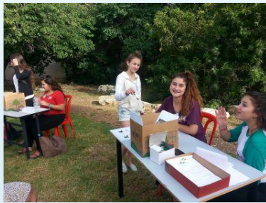
מימין: נציגי מועצת תלמידים שמחים לפגוש את המיועדים לשכבת ז'.