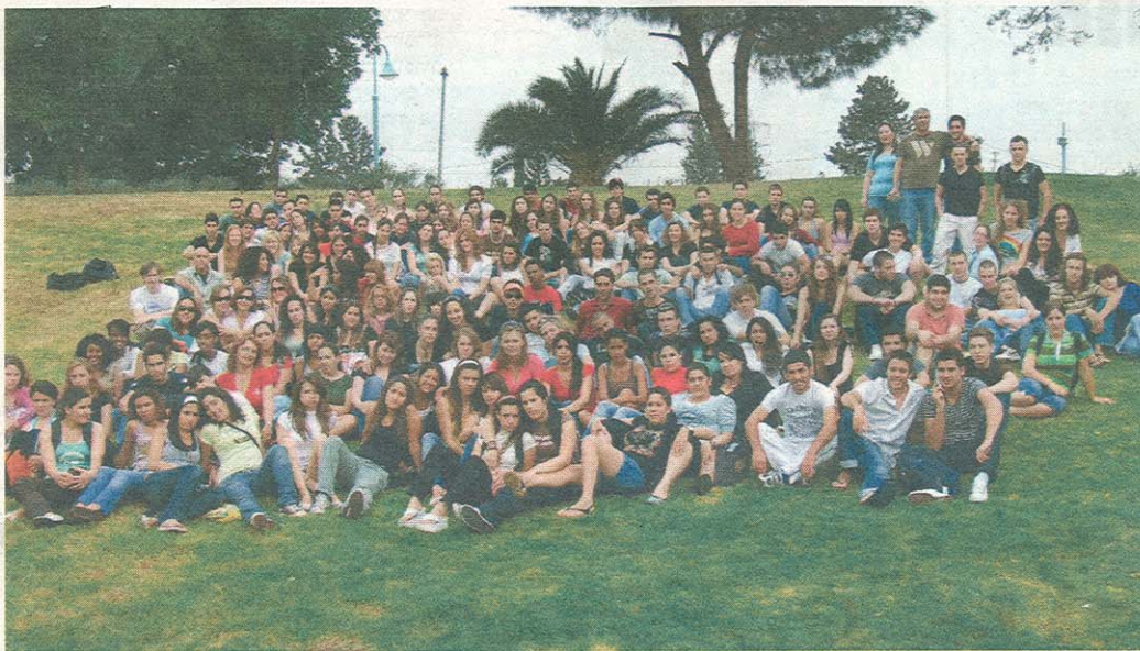
בוגרי כפר הנוער "ניר העמק" שרבים מהם התגייסו לשרות קרבי.

למגוון תפקידים. כולנו פועלים בכוחות משותפים - כמובן בשיתוף עם המורים, התלמידים וההורים. לשמחתנו, לאורך השנים אנו מגלים שרבים מבוגרינו השתלבו בתפקידים בחיל בצה"ל, כמפקדי חטיבות, יחידות סודיות וכטייסים בחיל האוויר. אני יכול להבטיח שאנו לא מתכוונים לשקוט על השמרים וגם בעתיד נעשה הכול בכדי שהתלמידים הצבאיות. אני והצוות החינוכי נפעל להמשיך להשתית את אותם ערכים באמצעות הלימודים בבית הספר דוגמת מגמת ארץ ישראל הייחודית ודוגמת גרעיני הנח"ל, סיכום גושן,