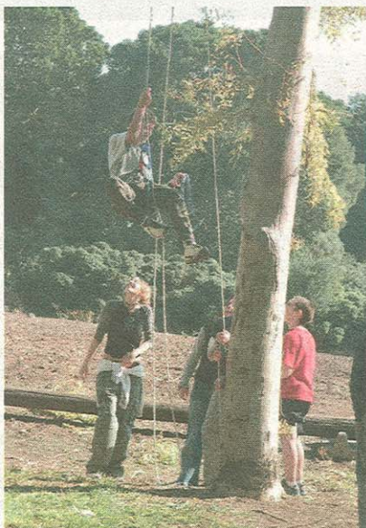
תלמידי "עמק" עמק חרוד בפעילות אתגרית.