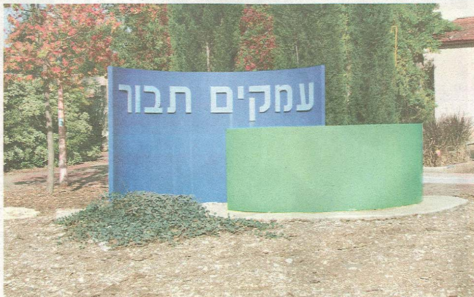
ביה"ס המוביל את הרשימה: "עמקים תבור" בקיבוץ מזרע.