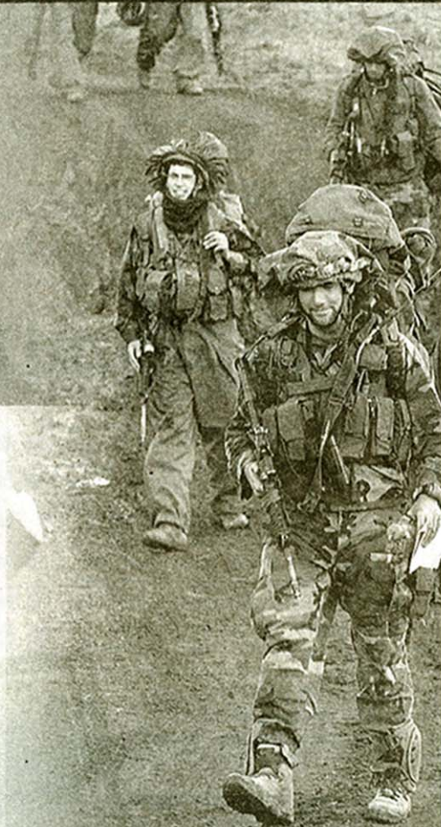
קרבי לא בבית ספרנו

מנהל עירוני א' בת"א, שממוקם גבוה ברשימת הלא קרביים, יורה לכל הכיוונים