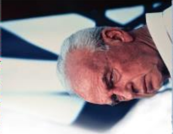
18 שנים לרצח יצחק רבין

עצרת מרכזית 12.10.13 מוצ"ש 20:00 כיכר רבין תל אביב