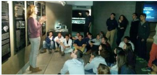
שומעים הסברים על רקע קיר פחיות קוקה קולה, ובמוזיאון היהלומים.

כפועל יוצא מחזון בית הספר המעודד למידה מעניינת ומאתגרת וחתירה למצינות יצאו תלמידי החט"ע ביום א' 15.2.15 לסיור לימודי במסגרת מגמות הבחירה. המטרה - העשרתם ע"י חשיפה להיבטים יישומיים, מחקריים ויצירתיים של מקצועות הבחירה. כל מגמה יצאה למקום אחר והתלמידים חזרו עמוסי חוויות.