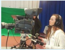
משמאל: מצלמים ומצטלמים במגמת תקשורת