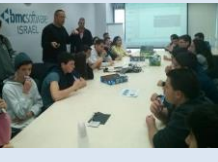
מימין: מאזינים להרצאת מנהל BMC משמאל: סימולציות בטכנודע. למטה