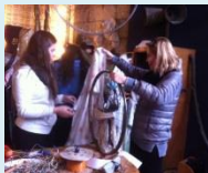
מצירים בנוף, ויוצרים ב"מעבדאדא".

התלמידים צפו בסרט "תלויים באוויר" ופגשו את הבמאי רמי כץ. בהמשך היום עבדו תלמידי י' ו-י"א באולפן מכללת עמק יזרעאל בהפקת תכנית דוקו ותלמידי י"ב נפגשו עם הבמאי לייעוץ על סרטי הגמר שלהם.