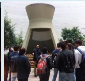
מימין לשמאל: מקבלים הסבר ליד דגם הארובה בבז"ן, מעבדת האלמוגים וחוף חיפה.