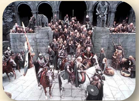
סצנה מתוך הסרט "שר הטבעות- שני הצריחים" מאת טולקין. שייך לפנטסיה הגבוהה

את הספרות הפנטסטית העשירה והמגוונת ניתן לחלק לתת-סוגות, ושוב, בעיות ההגדרה קשות וקווי הגבול מטושטשים תמיד. מכל מקום, הבחנה חשובה היא בין פנטסיה גבוהה (fantasy high) לבין פנטסיה נמוכה (low fantasy). בתחום הראשון יוצר המחבר עולם שלם, מתווה את חוקי פעולתו (החייבים להיות שונים במובהק מחוקי הפעולה של עולם המציאות, וכאמור, עקביים בדקדקות כלפי עצמם), ומפתח גיאוגרפיה, היסטוריה, פוליטיקה, דמוגרפיה, בלשנות, זואולוגיה, בוטניקה ועוד, כרקע לעלילה עצמה, כמאגר שממנו נלקחות הנפשות הפועלות וכמתווה לחוקיה הפנימיים של היצירה. כמובן, הדמוגרפיה תכלול בדרך כלל יצורים דמויי-אדם שאינם בני אדם "רגילים", הזואולוגיה תכלול חיות אגדיות שונות – הדרקונים הם הפופולריים ביותר, אבל יש עוד כהנה וכהנה – והבוטניקה אולי תכלול עצים מהלכים ומדברים. העולם שנוצר כך עשוי להשיק לעולמנו המציאותי בנקודות מסוימות, אבל השוני בין השניים מרובה. לפנטסיה הגבוהה שייכים "שר הטבעות" של טולקין וספרי הארי פוטר של הולינג, ועוד רבים מאוד.