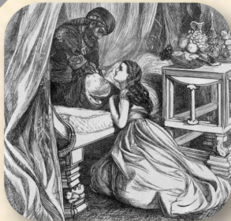
אלף לילה ולילה. איור של א' הוגטון, 1880 בקירוב

רוב היצירות הנזכרות לעיל שייכות לתת-סוגה שתוארה לעיל כפנטסיה גבוהה, ורק מיעוטן שייכות לפנטסיה הנמוכה. עם זאת, החל מהמאות הראשונות לספירה הכללית החלה כתיבתן של יצירות דתיות – כתבי הקודש של הדתות המונותאיסטיות ופרשנויותיהם, וכן אלה של אחדות מהדתות הפוליתאיסטיות – וגם אלה כללו במידה מועטה או מרובה רכיבים של פנטסיה נמוכה. יש להבחין כאן בין מעשים שמחוץ לגדר הטבע, אשר נעשו בידי האל במישרין או בעקיפין, כמו קריעת ים סוף – אין זו פנטסיה כהגדרתה לעיל, משום שפעילות "על-טבעית" מעין זו אמורה להיות חלק מהגדרתו של עולם המציאות במסגרת כתבי הקודש – לבין רכיבים פנטסטיים שכנראה השתרבו לכתבי הקודש ממסורות קדומות יותר. לדוגמה, ספרבראשית מזכיר כבדרך אגב (ו' ד') כי "הנפילים היו בארץ בימים ההם וגם אחרי-כן". אבל גם כאן, אין צורך לומר, הגבולות מטושטשים.