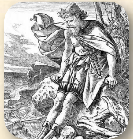
מסעותיו של המלך אודיסאוס המתוארים ב"אודיסיאה" של הומרוס

ימי הפנטסיה הם כימי הספרות העולמית; למעשה, במשך רוב תולדות הספרות הבדיונית, ספרות ושירה פנטסטיות היו היחידות שבנמצא. כל סיפורי העלילה המהווים חלק מהמיתולוגיות של עמי העולם הם סיפורי פנטסיה, בעיקרו של דבר – החל באפוס גילגמש הבלבי, שנכתב לפי המשוער בסביבות שנת 2000 לפנה"ס. באותה עת בקירוב נכתב גם ספר המתים המצרי, אם כי המרכיב העלילתי בו זעום ביותר. מעט יותר מאלף שנה אחר כך, שוב לפי המשוער, חיבר הומרוס את האיליאדה והאודיסיאה – שתי יצירות פנטסיה שרבים רואים אותן כניצבות ביסוד הספרות המערבית. ממשיכי דרכו העלו על הכתב עוד ועוד סיפורי פנטסיה במסגרת המיתולוגיה היוונית.