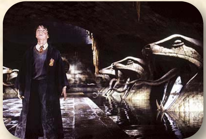
הארי פוטר וחדר הסודות

זרם אחר, נפרד משאר הפנטסיה במובנים רבים אך שייך לה בכל זאת, נולד במסגרת הקומיקס, המשלבת ייצוג גרפי ותוספות מילוליות. זהו זרם "גיבורי-העל" (superheroes), שנעשה פופולרי בארה"ב בשנות ה-30 וה-40 של המאה ה-20, ובהמשך התפשט מהקומיקס אל הקולנוע, הטלוויזיה ואף הספרות. רוב גיבורי-העל הללו, שהידועים מביניהם הם סופרמן, ספיידרמן וקפטן אמריקה, נראים כאנשים מן השורה, אך למעשה הם מחוננים ב"כוחות" מיוחדים במינם (למעשה, ביכולת כישוף כזו או אחרת), ומנצלים אותם למלחמה נגד הפשע, ובייחוד נגד מדענים מטורפים המבקשים להשתלט על העולם. בטמן, גם הוא מן הידועים שבגיבורים הללו, שונה מהם בכך שאין לו כוחות-על, אלא רק ידע מדעי עשיר בצירוף למשאבים כלכליים מרובים. למרות כל השוני, המתחמים אחר שושלת היוחסין של סופרמן אולי יצליחו להגיע אלהרקלס היווני.