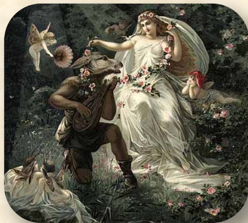
חלום ליל קיץ השייקספירי

אך בשנים שלאחר מכן הודחה הפנטסיה למעמד של ספרות ילדים, לכל היותר. אפילו יצירות שלא נכתבו לילדים מלכתחילה, כמו לקט סיפורי העם של האחים גרים ו"מסעי גוליבר" של סוויפט, הוסבו במהירות לסיפורי ילדים משעשעים (או מפחידים מטעמים "חינוכיים"), ומקורותיהם כמעט נשכחו מלב. המחברים שהמשיכו לכתוב סיפורי פנטסיה למבוגרים היו מתי-מספר, ויצירותיהם לא הטביעו חותם של ממש בתולדות הספרות המודרנית (מארק טוויין, לדוגמה, הנציח את שמו בזכות "הקלברי פין" ו"טום סויר", ולא בזכות "ינקי מקונטיקט"; בדומה לכך, סר ארתור קונן דויל התפרסם בזכות שרלוק הולמס ולא בזכות ספריו הפנטסטיים כמו "העולם האבוד").