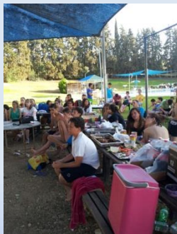
מאזינים לברכות, מברכים ונפרדים במפגש הסיום של המועדון הבית-ספרי