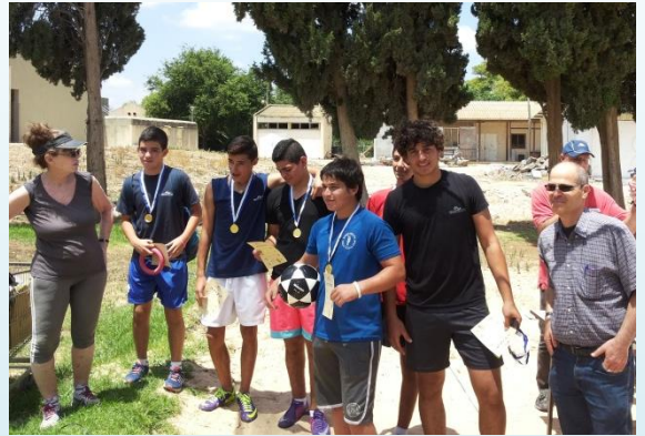
מדליות לזוכים בקט-רגל

גמר אליפות קטרגל בחטיבת ביניים לקראת סוף שנת הלימודים - אליפות חטיבת הביניים בקט-רגל הגיעה לסיומה, עם זכיית נבחרת הבנים של ט' 1 באליפות, לאחר שגברה במשחק הגמר על נבחרת הבנים של ח' 1 0:2 בבעיטות עונשין. בתום המועד החוקי של המשחק ובתום חמש דקות הארכה, הסתיים המשחק בתיקו 0:0. באליפות, שהתקיימה באווירה נעימה, ספורטיבית וחינוכית, השתתפו ארבע עשרה קבוצות ונערכו ארבעים ושישה משחקים. יישר כוח וכל הכבוד לכל הקבוצות!